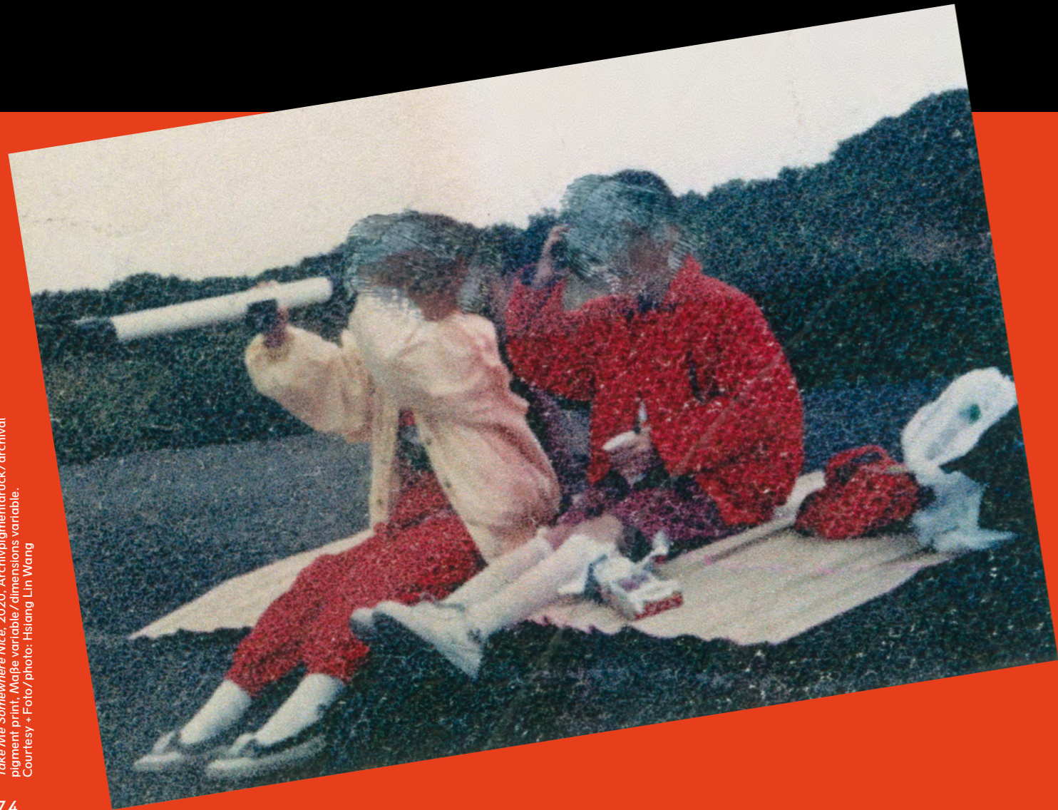
Take Me Somewhere Nice, 2020, Archivpigmentdruck / archival pigment print, Maße variabel / dimensions variable, Courtesy + Foto/photo: Hsiang Lin Wang