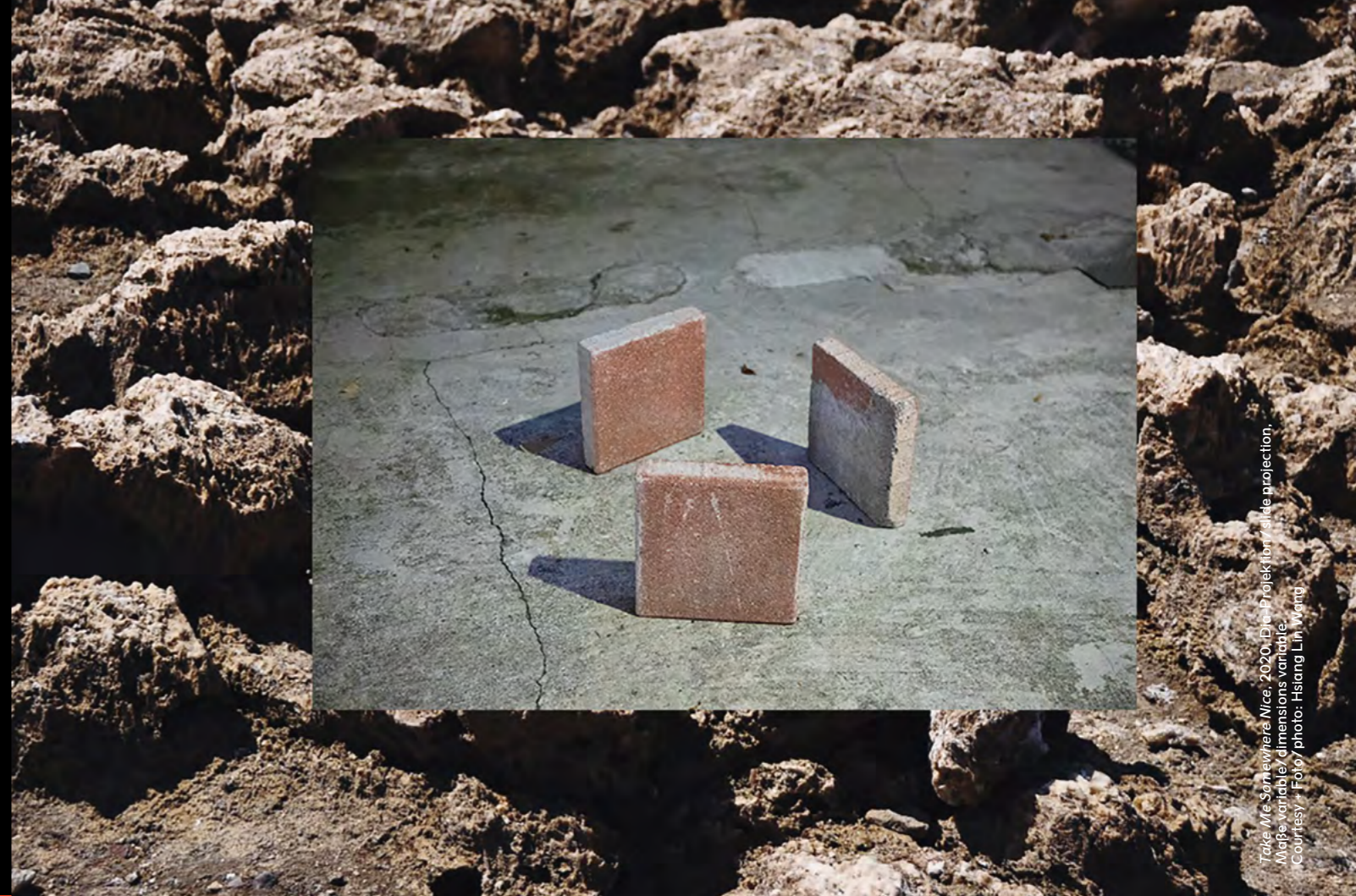
Take Me Somewhere Nice, 2020, Dia-Projection / slide projection, Maße variabel / dimensions variable