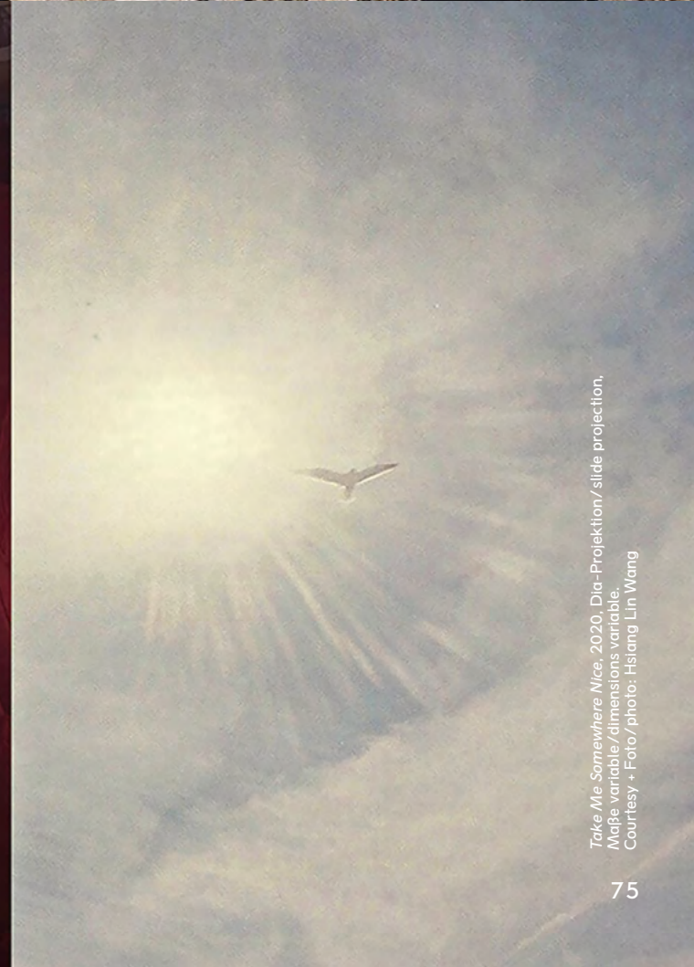
Take Me Somewhere Nice, 2020, Dia-Projection / slide projection, Maße variabel / dimensions variable, Courtesy + Foto/photo: Hsiang Lin Wang